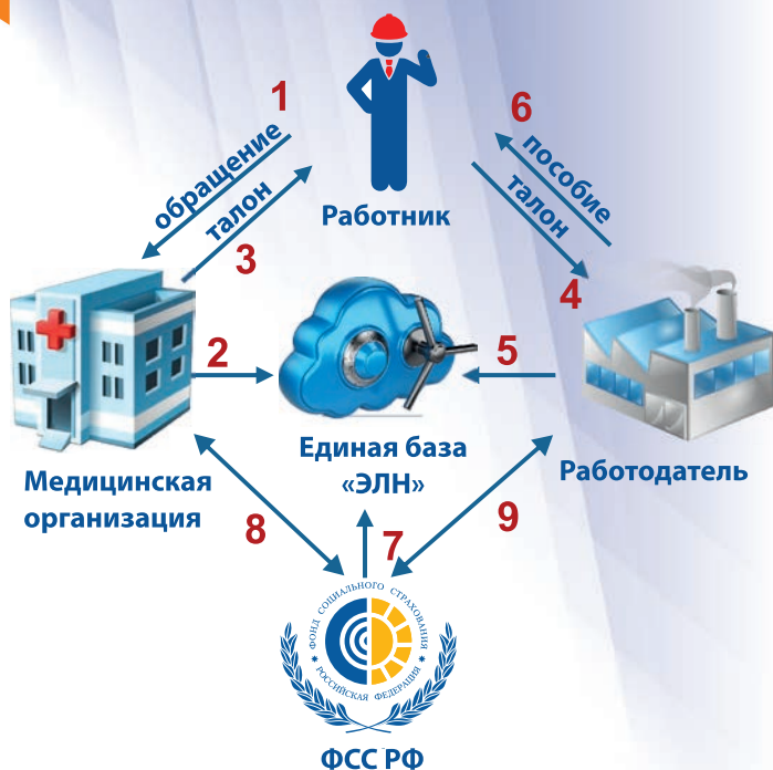
СХЕМА ВЗАИМОДЕЙСТВИЯ «Электронный листок нетрудоспособности»