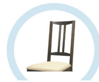
СПИНКИ СТУЛЬЕВ, НЕ ОБИТЫЕ ТКАНЬЮ И МЯГКИМ ПОРИСТЫМ МАТЕРИАЛОМ