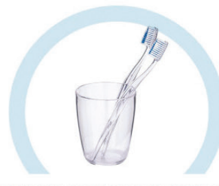
ТУАЛЕТНЫЕ ПРИНАДЛЕЖНОСТИ (ЗУБНЫЕ ЩЕТКИ, РАСЧЕСКИ И ПР.)