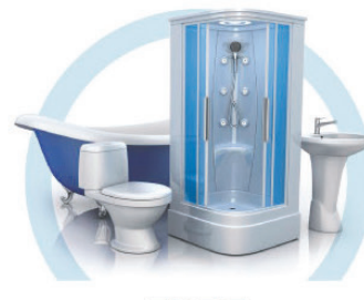
ТУАЛЕТ (УНИТАЗ, ВАННА, ДУШЕВАЯ КАБИНА, БИДЕ)

Газета зарегистрирована Управлением Федеральной службы по надзору в сфере связи, информационных технологий и массовых коммуникаций по Иркутской области Свидетельство ПИ № ТУ38-00348 от 13 мая 2011г.