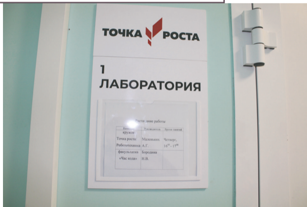
2. Компьютерным оборудованием оснащена Юголуцкая средняя школа.