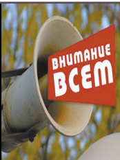
На случай чрезвычайных ситуаций Стр. 5