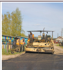
Транспортный каркас Стр. 5