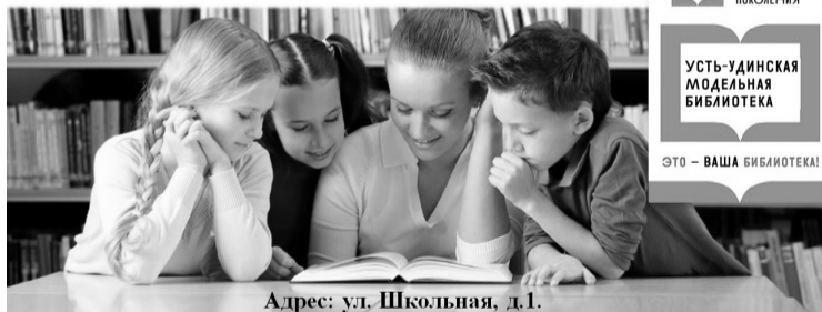
Адрес: ул. Школьная, д.1.

Будем рады видеть всех в нашей обновленной библиотеке 14 февраля в 14:00