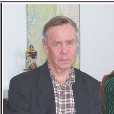
"Памяти Валентина Распутина" Стр. 8