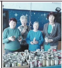
"Работа по зову сердца, по зову Родины" Стр. 8