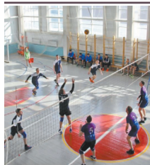
"Турнир V районов" Стр.4-5